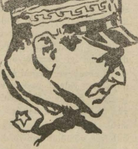
Habeş hudutlarına gönderilen İtalyan baş kumandanı GENERAL GRAZİYAN

Ateşe mukabil ateş açan İtalyan kuvvetleri, Habeş askerlerini püskürtmeğe muvaffak olmuşlardır. Habeşler den bir ölü vardır.